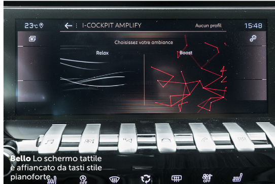
Bello Lo schermo tattile è affiancato da tasti stile pianoforte