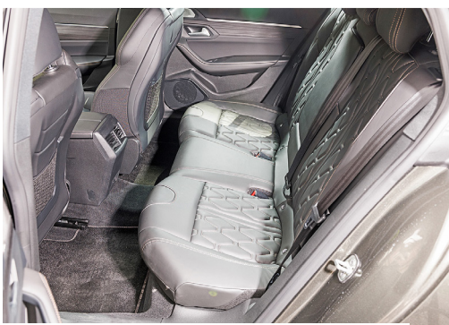
Mediocre, lo spazio offerto ai passeggeri.