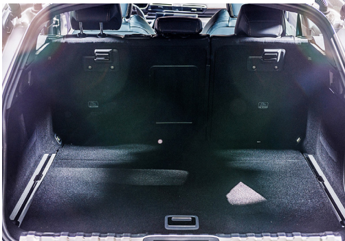
Il pratico bagagliaio ben rivestito.