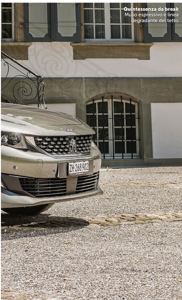
Quintessenza da break Muso espressivo e linea degradante del tetto.