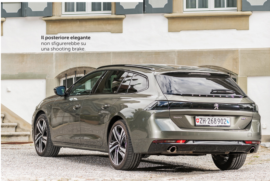
Il posteriore elegante non sfuggirebbe su una shooting brake.