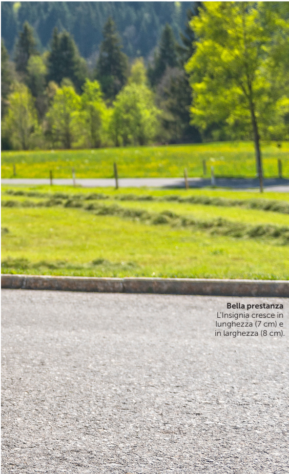
Bella prestanza L'Insignia cresce in lunghezza (7 cm) e in larghezza (8 cm).