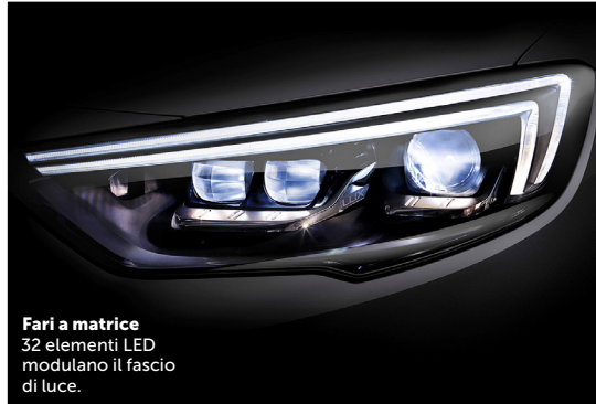
Fari a matrice 32 elementi LED modulano il fascio di luce.