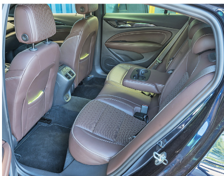
Spaziosa Normale con i suoi 4,90 m.