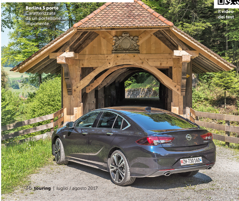
36 touring | luglio / agosto 2017