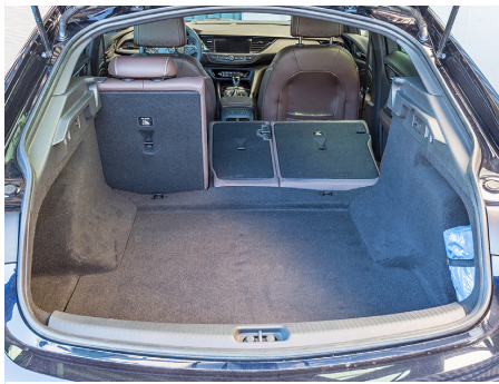
Accessibile Volume del bagagliaio quasi uguale.

Berlina 5 porte Caratterizzata da un portellone imponente.