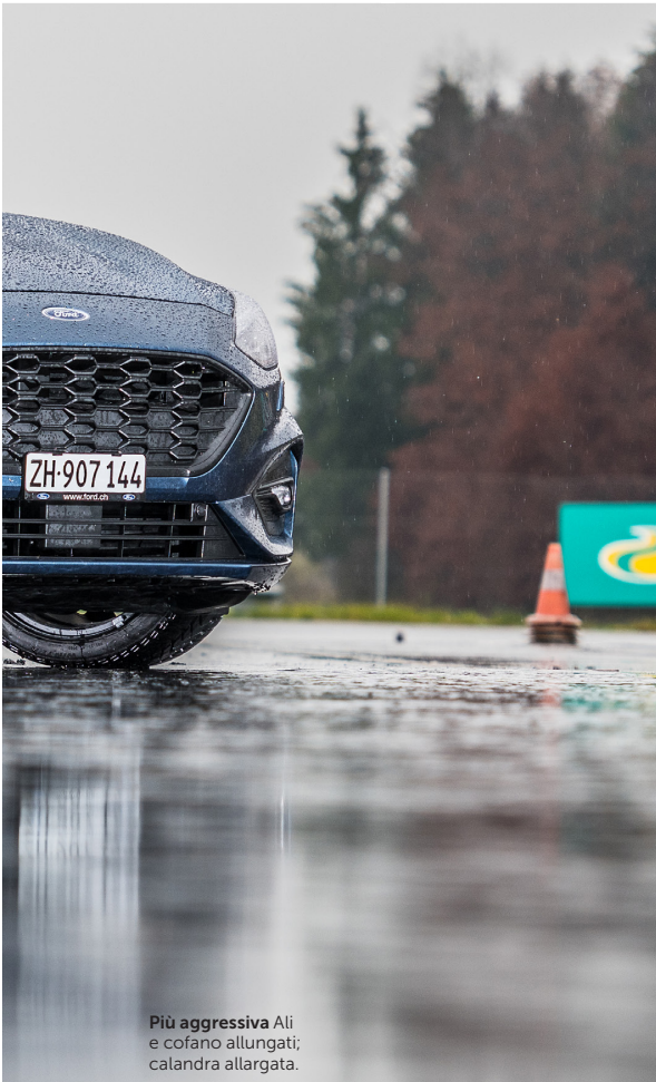
Più aggressiva Ali e cofano allungati; calandra allargata.