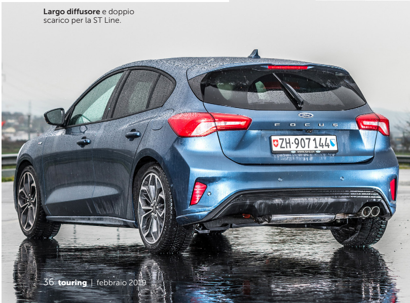
36 touring | febbraio 2019

Largo diffusore e doppio scarico per la ST Line.