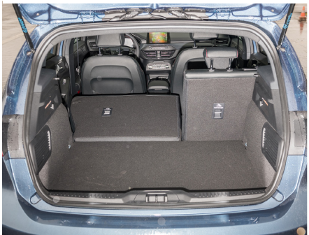
Un po' limitato a causa dell'impianto audio.

Largo diffusore e doppio scarico per la ST Line.