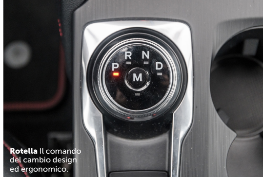
Rotella Il comando del cambio design ed ergonomico.