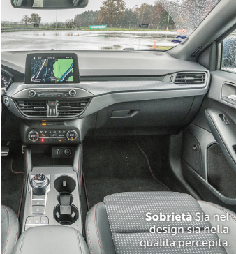
Sobrietà Sia nel design sia nella qualità percepita.