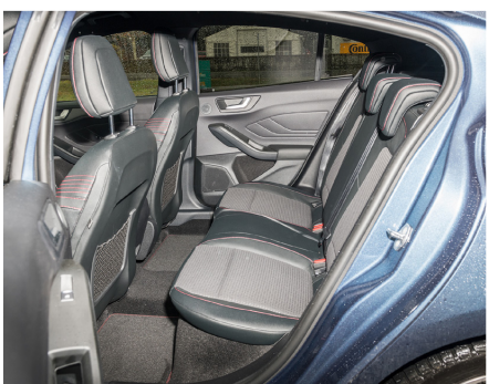
Nella norma delle vetture compatte.