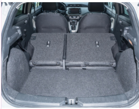
La modularità è sufficiente.

Un design vivace fa fare bella figura alla quinta generazione Micra.