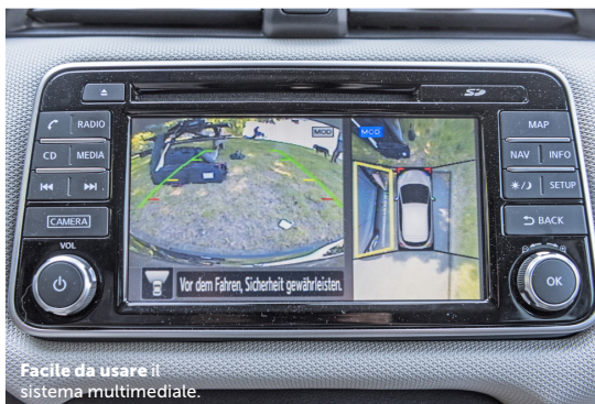
Facile da usare il sistema multimediale.