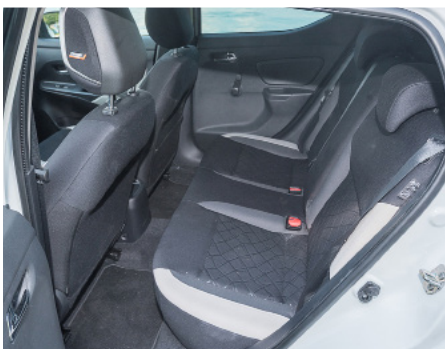
Dietro gli spazi sono ristretti.