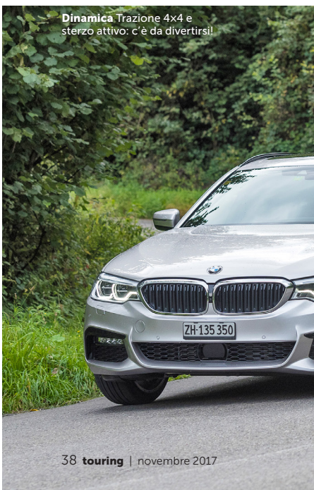
Dinamica Trazione 4x4 e sterzo attivo: c'è da divertirsi!