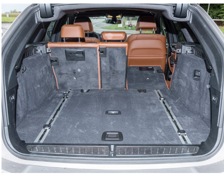
Ben configurato ma non enorme, il bagagliaio.