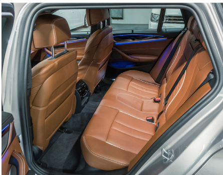
Accogliente divano dai contorni scolpiti.