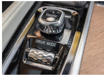
Chic L'accensione «diamante» e la ghiera che comanda le tre modalità di guida.

La station wagon V90 innova anche inaugurando un diesel 2 l che brucia i tempi di risposta del turbo. Un compressore elettrico inietta, nello spazio di 0,5 s, aria compressa che accelera l'entrata in funzione delle pale del turbo. Il quat-