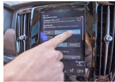
Futurista Lo schermo tattile funziona come un tablet di cui si scorrono i menu con le dita.

Come spesso accade per Volvo, l'efficacia del comportamento è preminente rispetto alle sensazioni di guida. Sebbene l'accogliente bozzolo regala l'impres-